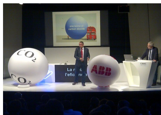
Fig1. Energy Efficiency Day de ABB, preparación, comité técnico, organización comercial y presentador del evento. LINK → https://www.youtube.com/watch?v=m8L4--G108s